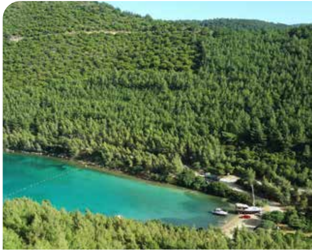
Бухта Тюркбюю (15 км)

Тюркбюю в северной части полуострова славится чистым морем и видами на бухту. Отличный маршрут для заката летом. (Рекомендуется на автомобиле.)