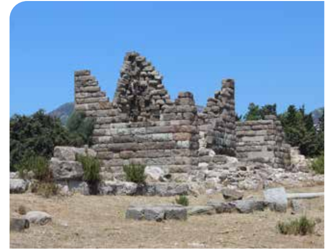
Античный город Миндос (5 км)

Гююшлюк — тихая бухта, популярная для заката и прогулок по берегу. Вид на Кроличий остров — популярная фототочка.