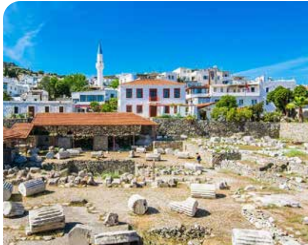
Мавзолей Галикарнаса (0,5 км)

Крепость Бодрум — символ города — одно из самых популярных мест с каменными улочками и голубой гаванью. Внутри крепости можно посетить Музей подводной археологии. Идеально для вечерних прогулок по старому городу. В нескольких минутах ходьбы — удобно для однодневного визита.