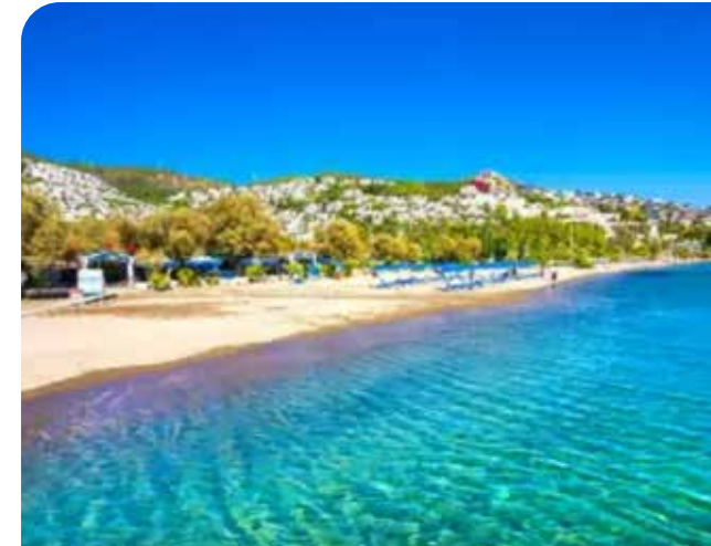
Пляж Битез (8 км)

В центре города можно увидеть руины Мавзолея Галикарнаса — одного из семи чудес света. Прогуливаясь вокруг, вы прикоснётесь к древнему прошлому Бодрума. Bitez Plajı (8 км)