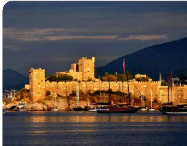
Крепость Бодрум и Старый город (0,5 км)

Крепость Бодрум — символ города — одно из самых популярных мест с каменными улочками и голубой гаванью. Внутри крепости можно посетить Музей подводной археологии. Идеально для вечерних прогулок по старому городу. В нескольких минутах ходьбы — удобно для однодневного визита.