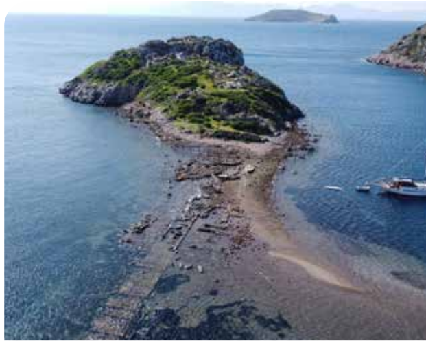
Гююшлюк и Кроличий остров (20 км)

Тюркбюю в северной части полуострова славится чистым морем и видами на бухту. Отличный маршрут для заката летом. (Рекомендуется на автомобиле.)